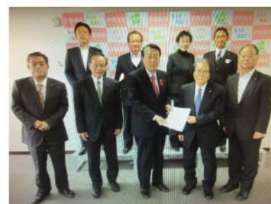
▲ 文教福祉部会長として、30年度会派伊 勢崎クラブ予算要望提出。