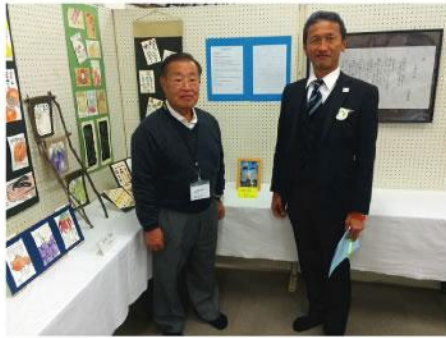
▲ 地元作品展、皆さんの生き甲斐で、日頃の生涯学習の成果素晴らしい作品、一般質問した予防医療を推進し健康寿命を延ばしましょう。