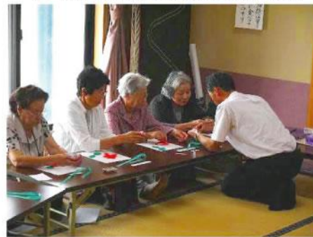
▲ 山王町JAMミニディ。皆さんと一緒に子どもの頃得意だったお手玉と合わせ、折り紙を楽しく折り、自身のテーマにしている「高齢者の居場所づくり」「地域支え合い体制づくり」構築へ向け役割を全うして行きます。