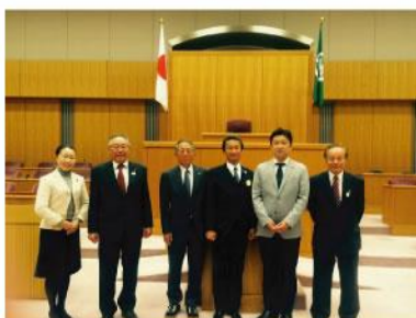
▲ 会派の総務部会文教福祉部会合同視 察。本市の状況に合わせた政策を積極 的に採り入れて行きます。