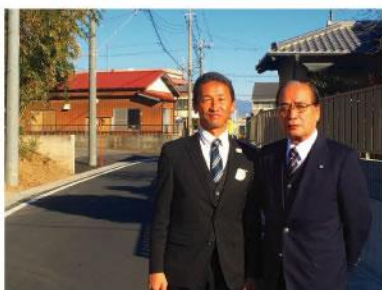
▲ 地元区長と連携し道路拡幅要望案件 お陰様で車のすれ違いが出来るように 成りました。