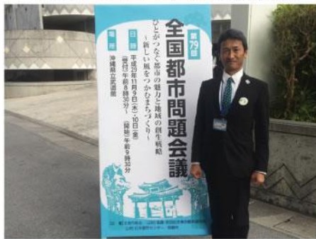
▲ 全国都市問題会議視察研修。人の繋がり地域の支え合いが人の動きを活発化していき、好循環が生まれ都市が発展していく事の重要性を感じました。