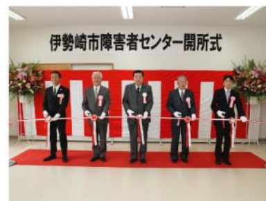
▲ 文教福祉常任委員会委員長として、伊 勢崎市障害者センター開所式出席、テ ープカット。