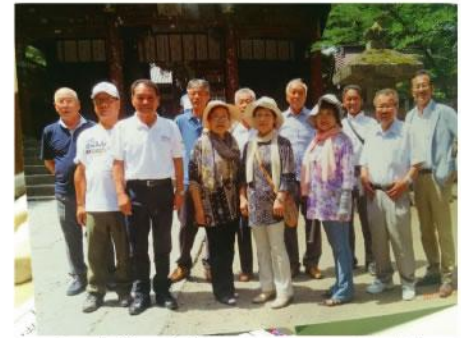
▲ 名和社協研修旅行同行。この2日間で御相談案件ノートが進み、本当に良いコミュニケーションが図れる事に感謝致します。