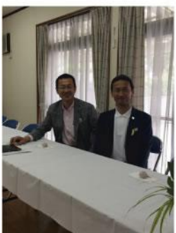
▲ 地元の行事を終え、本市主催の催し等大和県議と共に視察研修に同行。地元-伊勢崎-群馬を繋ぐ架け橋として連携し、最高のコンビネーションで動いております。