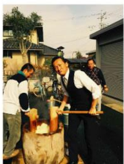
▲ 地域コミュニティーを常に大切にし餅つき等々地元の行事を通じて、名和幹線道路開通に向けた進捗、耕作放棄地や空き家の有効活用等、色々な意見交換をしています。