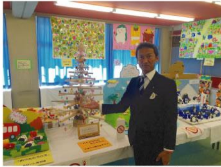
▲ 学童作品展鑑賞。29年6月議会一般質問でとりあげた「子どもの居場所づくり」や個性を伸ばして行くなど、子育て支援頑張ります!!