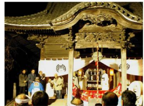
▲ 鬼子母神大祭にて御神酒をお渡します。鬼子母神堂は、昨年伊勢崎市重要文化財に指定されました。