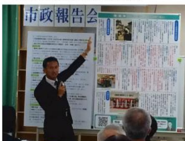
▲ 29年度市政報告会。日頃から『議員の 見える化』の為に毎年定期的に皆さん へ活動を報告。