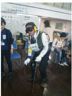
▲ 介護フェスタ疑似体験。要介護、その方の立場に立った貴重な体験が出来ました。地域包括支援センターを中心とした縦横の連携を密にして行けるよう監査提案して行きたいと思ひます。