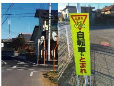
▲ 危険箇所カーブミラー取り付けスクー ルゾーンにグリーンベルト、路面及び注 意喚起標識を設置要望し実現しました。