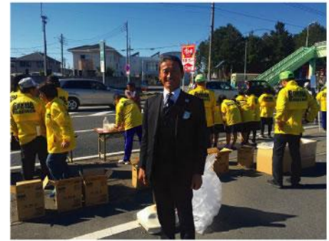
▲ シティマラソンに活かせればと思い群馬マラソンボランティアの方々の動きを含めて視察、応援。