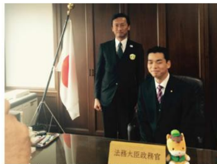
▲ 法務大臣政務官に就任された井野代議士と政務官室のデスクで記念撮影。市の要望を国へあげて頂けるよう連携して参りましょう。